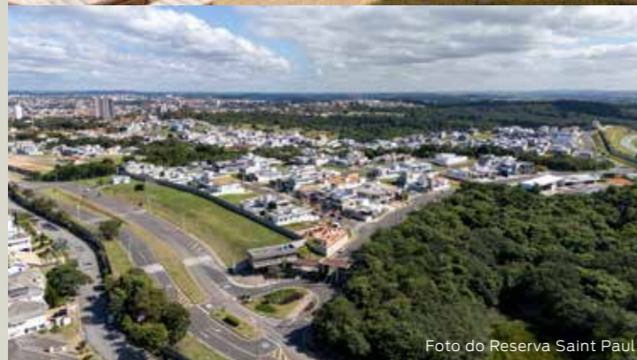
Foto do Reserva Saint Paul