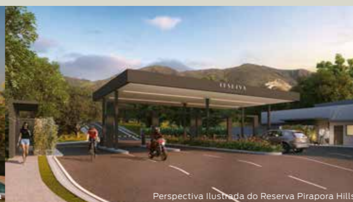
Perspectiva Ilustrada do Reserva Pirapora Hills