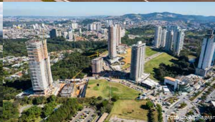
Foto do Alphagran