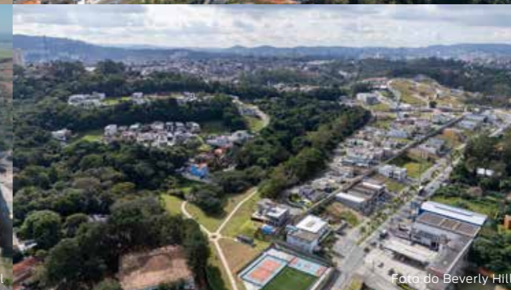
Foto do Beverly Hills