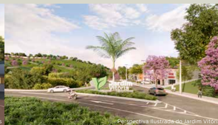
Perspectiva Ilustrada do Jardim Vitória