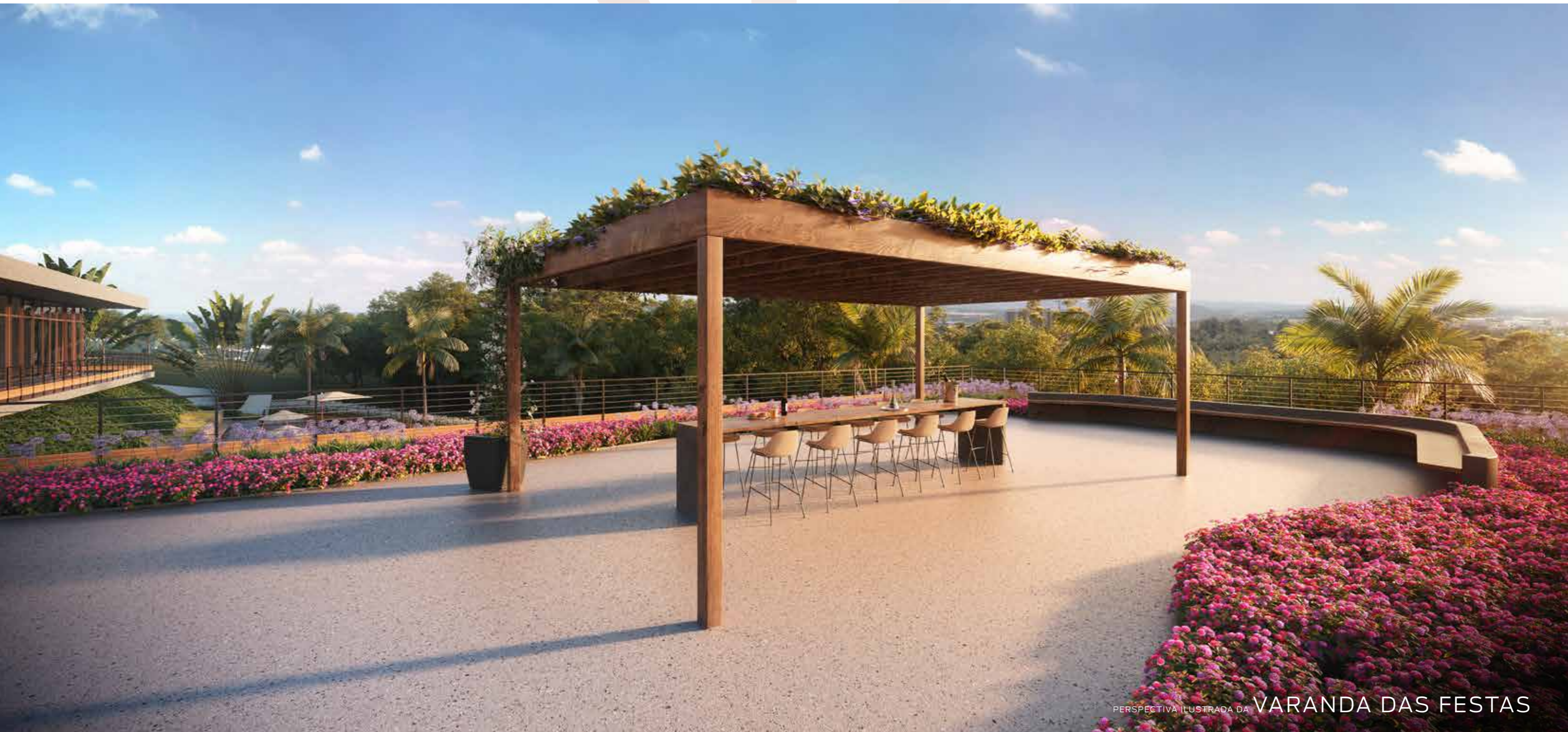
PERSPECTIVA ILUSTRADA DA VARANDA DAS FESTAS