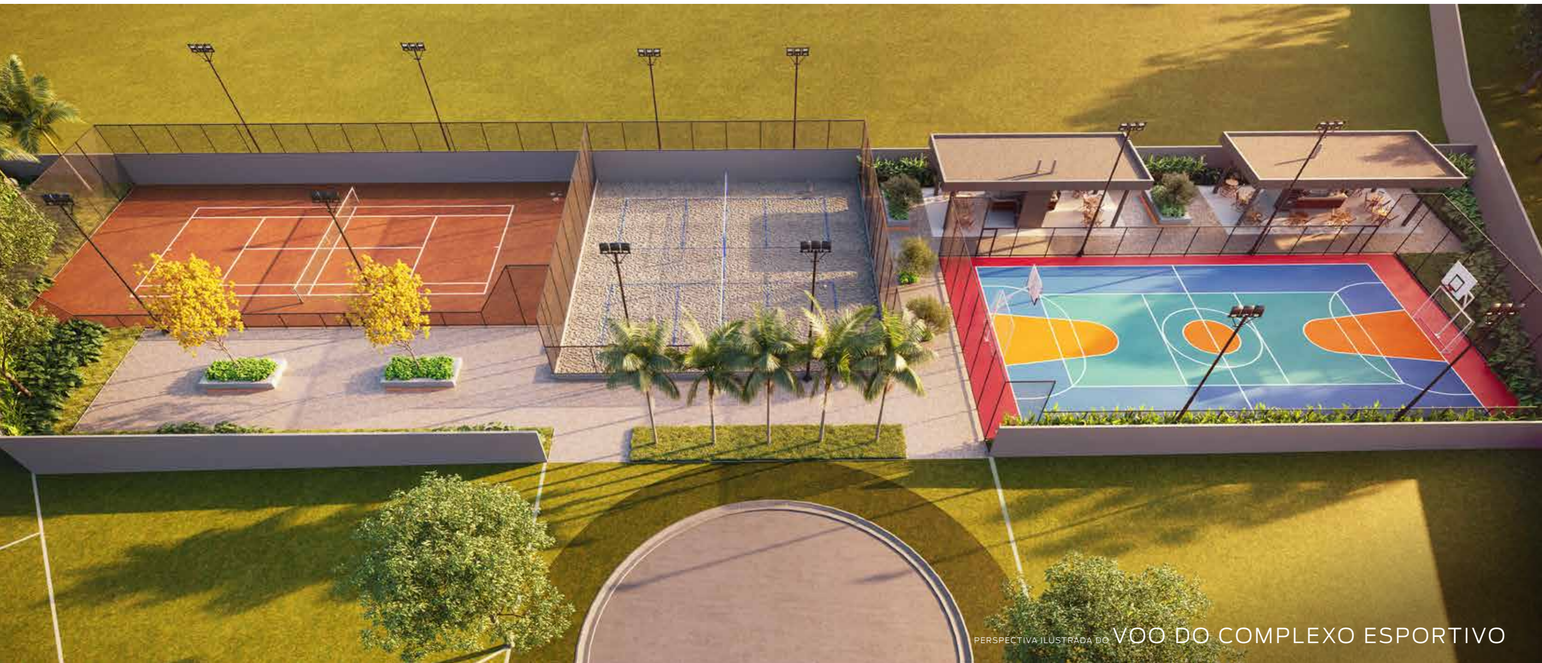
PERSPECTIVA ILUSTRADA DO VOO DO COMPLEXO ESPORTIVO