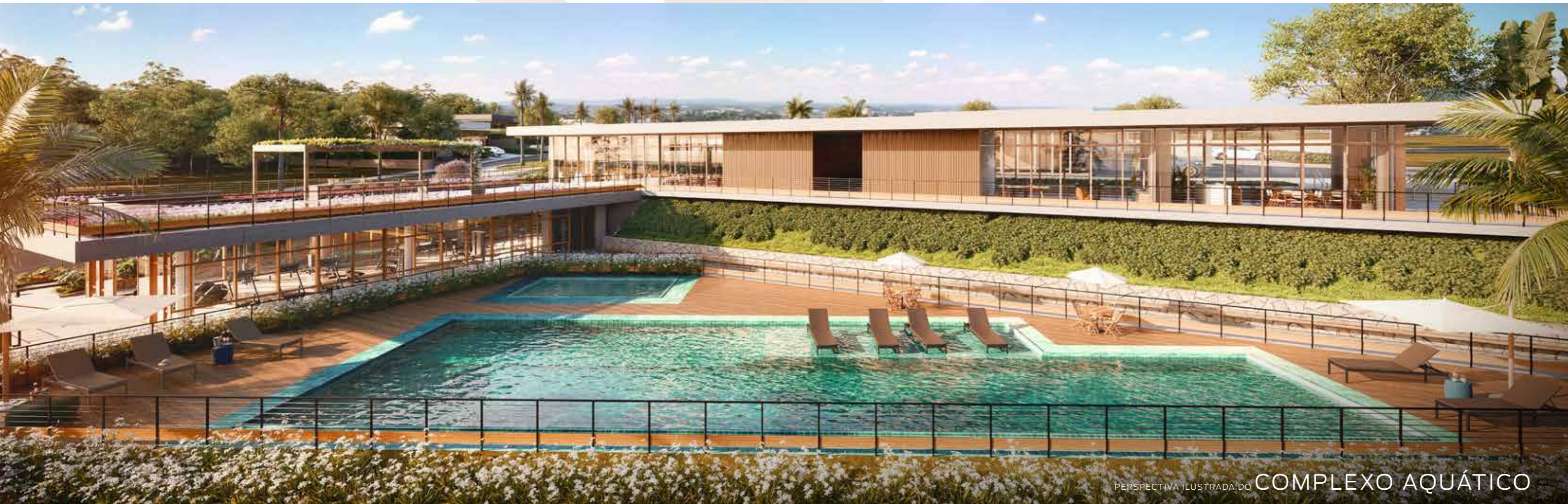
PERSPECTIVA ILUSTRADA DO COMPLEXO AQUÁTICO