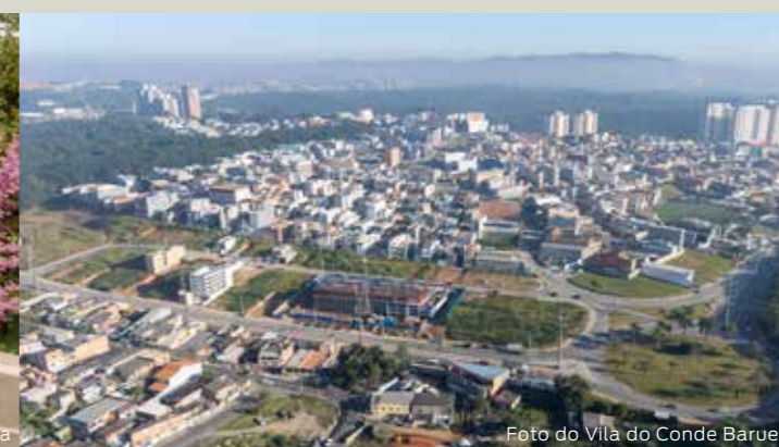
Foto do Vila do Conde Barueri