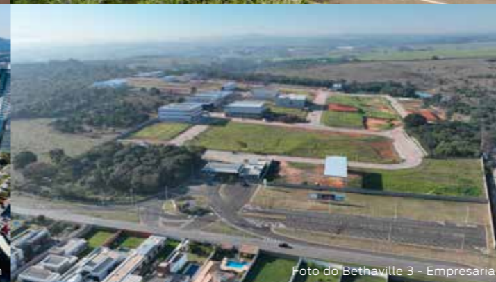
Foto do Bethaville 3 - Empresarial